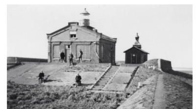
Kraggenburg, in de jaren '40. Op het schuurtje naast de woning is de lantaarn nog aanwezig.