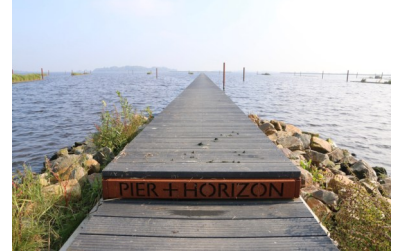
Het landschapskunstwerk Pier + Horizon.