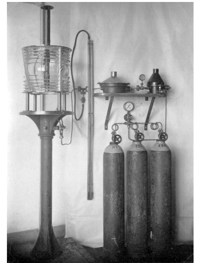
De optiek van Kraggenburg die voor 1940 dienst deed. Rechts de gascilinders voor de voeding van het gloeilicht.