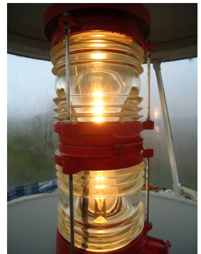
De dubbellenslantaarn die in 2016 in het lichthuis van Oud-Kraggenburg werd geplaatst.