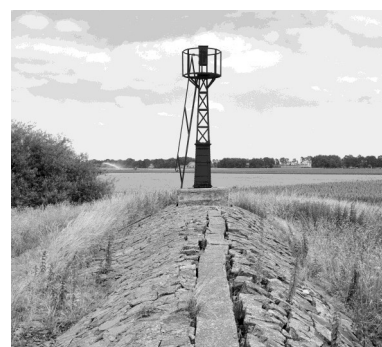
Een serie foto's van Oud-Kraggenburg in juni 1999.