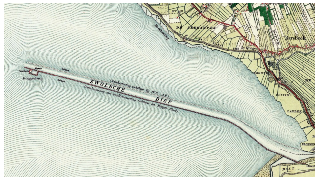
Het Zwolse Diep in 1900. Aan het eind van de zuidelijk leidam bevinden zich de vluchthaven en de terp met de lichtwachterswoning.