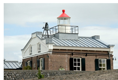
Oud-Kraggenburg in 2014.