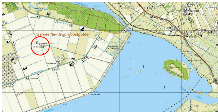
Een deel van de Noordoostpolder en de monding van het Zwolse Diep op een recente topkaart. Oud-Kraggenburg bevindt zich in de rode cirkel.

door Peter Kouwenhoven / Nederlandse Vuurtoren Vereniging (www.vuurtorens.org), mei 2026