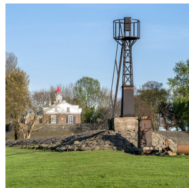
De replica van het geleidelicht uit 1919 op de zuidelijke leidam. De vervallen originele lichtopstand ligt ernaast.