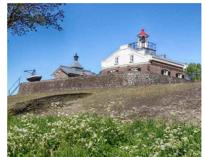
Oud-Kraggenburg in 2018. Het schuurtje heeft weer een lantaarn.