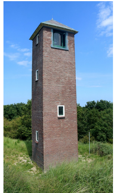
De gerenoveerde Sergeant in 2024.

Doordat onderhoud lange tijd achterwege bleef verkeerde de Sergeant in 2021 in zeer slechte staat. Het metselwerk brokkelde af en de kozijnen werden aangetast door houtrot. Rijkswaterstaat gaf in 2023 opdracht voor herstel van de toren. De renovatie werd betaald door Vlaanderen, toen nog eigenaar van de toren. De Sergeant werd in 2026 in goede staat overgedragen aan de gemeente Veere.