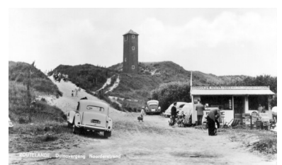
Het kustlicht en 'Friet van Piet' in de jaren 1960.