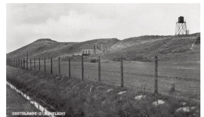
Lichtwachterswoning en lichtopstand omstreeks 1935.

Tijdens de Tweede Wereldoorlog waren de geleidelichten van het Oostgat in handen van de Duitsers en meestal gedoofd om geen richtpunten voor geallieerde bombardementen te geven. De Slag om de Schelde in oktober en november 1944 bracht enorme schade toe aan Walcheren en Zeeuws-Vlaanderen. De lichtwachterswoningen van Zoutelande en Kaapduinen werden daarbij compleet vernield.