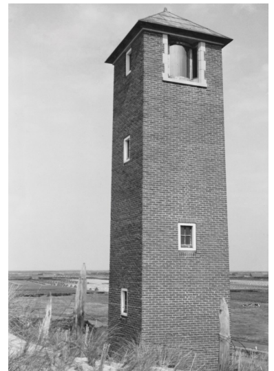
Het nieuwe kustlicht omstreeks 1960.