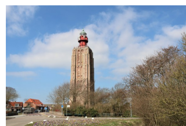
Het licht van Zoutelande vormde lange tijd een lichtenlijn met het hoge licht van Westkapelle.