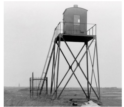
De lichtopstand van Zoutelande in de jaren 1930.