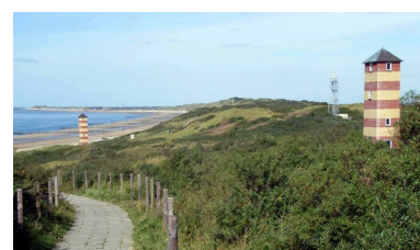
De lichtopstanden van Kaapduinen.