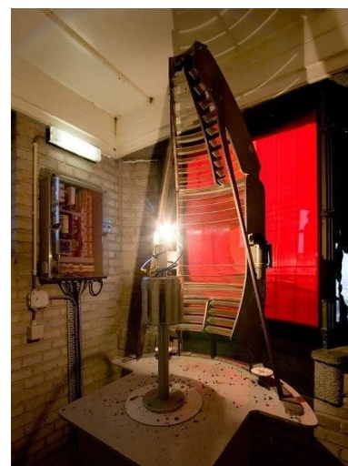
De huidige optiek van Zoutelande. Het rode scherm werd in 2015 vervangen door een zwart scherm met een verticale spleet. Dat werd vervolgens in 2021 weer verwijderd.