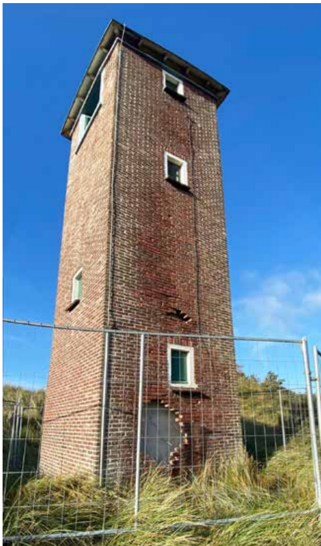
De lichtopstand van Zoutelande in verval.

Langs de Westerschelde staan tientallen lichtopstanden. Deze waren nodig om schepen te begeleiden naar de haven van Antwerpen. Drie bijzondere bakstenen lichtopstanden staan op Walcheren, bij Zoutelande en bij Dishoek (Kaapduinen). In juni 2021 heeft de Nederlandse Vuurtoren Vereniging voor deze drie torens en de lichtwachterswoning van Kaapduinen een monumentenstatus aangevraagd bij de gemeente. Terwijl deze aanvraag nog altijd in behandeling is, verslechtert de situatie van de drie lichtopstanden. Met name de staat van het licht van Zoutelande – ‘de Sergeant’ in de volksmond – is zorgelijk.