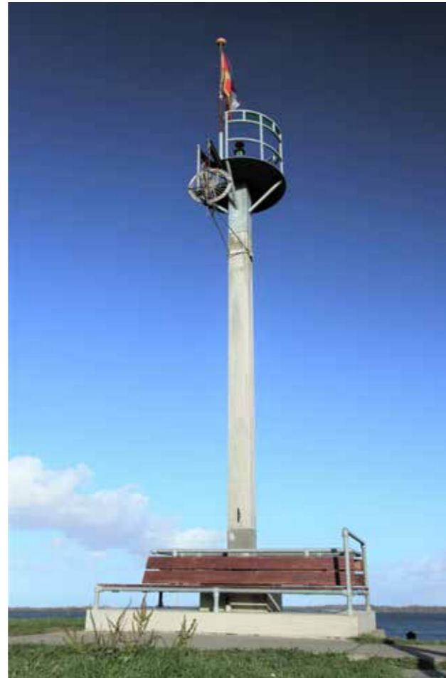
De replica van de lichtopstand van Oostmahorn.

De drie lichtopstanden van Zoutelande en Dishoek zijn eigendom van België. De eerste lichten zijn op deze locaties ontstoken in 1866. De bakstenen lichten die er vandaag de dag staan dateren van 1951. De lichtopstand van Zoutelande verkeert in slechte staat. Het meest in het oog springend is het grote gat in het metselwerk. Onder de toren liggen de losgekomen bakstenen in het gras. De slechte staat van de houten kozijnen en de aanslag op de mortel doen vermoeden dat er geen structureel onderhoud meer wordt uitgevoerd. De vuurtorenvereniging maakt zich ongerust over het voortbestaan van de lichtopstanden. Begin november hebben we daarom opnieuw een brief naar de gemeente gestuurd, waarin we nogmaals een nadrukkelijk beroep doen op het college van B&W om op korte termijn de lichtopstanden te voorzien van een (voor-)bescherming, in afwachting van de besluitvorming over de monumentenstatus. Alleen als de torens beschermd worden als monument, kan de eigenaar (het Vlaamse gewest) verplicht worden om het te onderhouden.