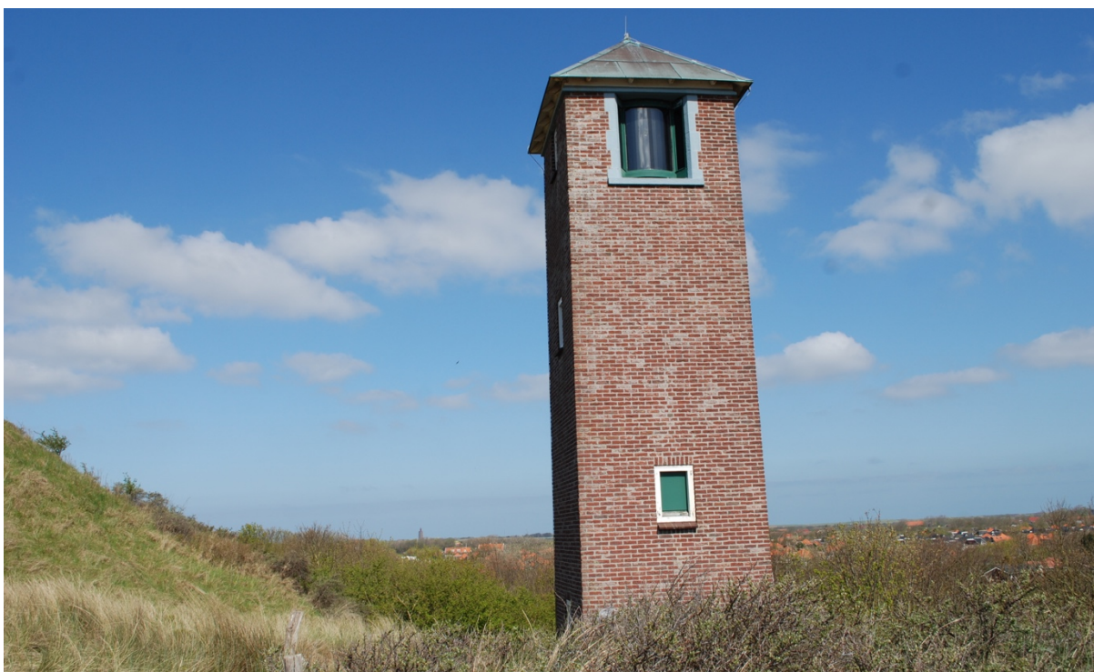
Lichtopstand 'de Sergeant' in Zoutelande