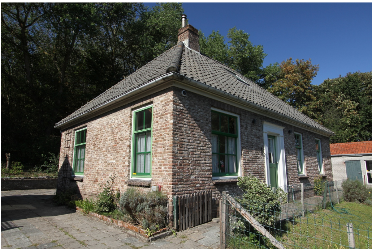
Lichtwachterswoning in Dishoek