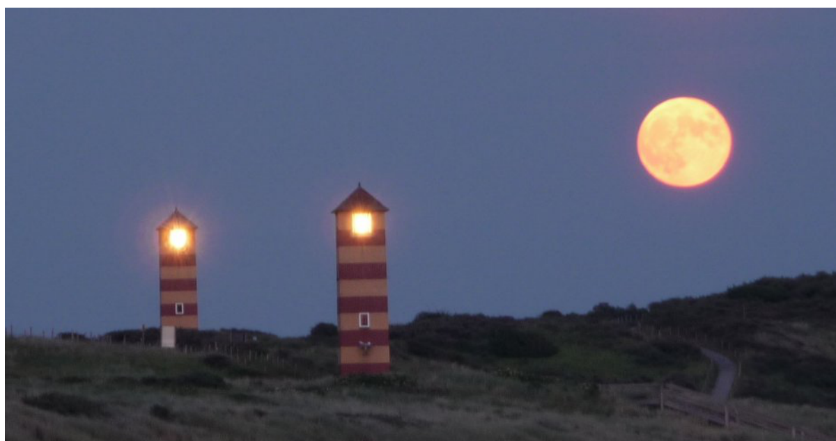
Lichtenlijn Dishoek – Hoge en lage licht naast elkaar