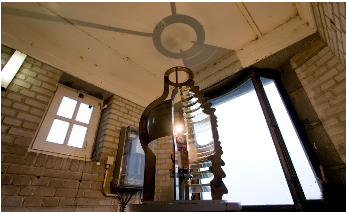
Lichthuis Hoge Licht Dishoek