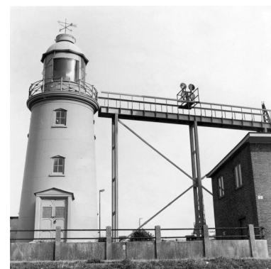
In 1967 is het licht in de gietijzeren toren gedooft en hebben drie schijnwerpers op een stelling naast de toren de functie van het lage licht overgenomen. De foto dateert van 1973.