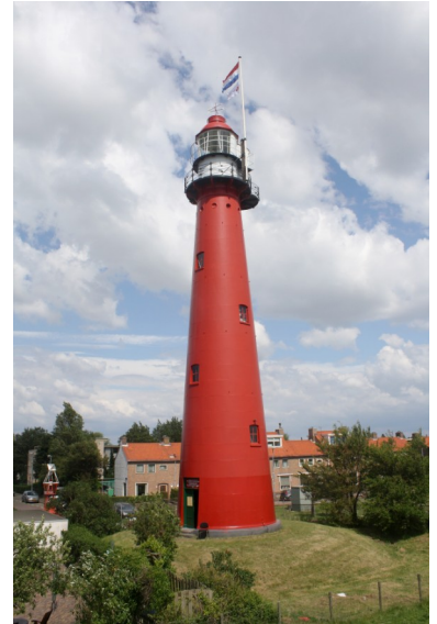
Het hoge licht van Hoek van Holland, thans kustverlichtingsmuseum.

Het torentje is onderdeel van de museumcollectie, bedreigingen lijken er niet te zijn. In Hoek van Holland komt af en toe de wens op om het vuurtorentje terug te halen naar zijn oorspronkelijke plek.