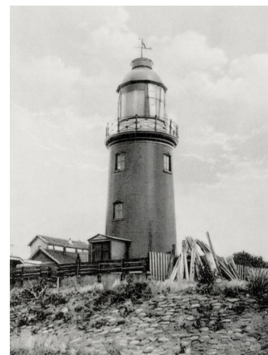
Het gietijzeren lage licht in 1930.