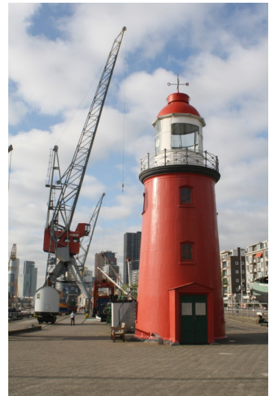
Het lage licht van Hoek van Holland in de museumhaven van het Maritiem Museum in Rotterdam.