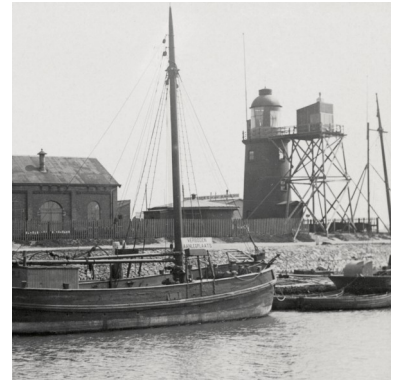
Van 1908-1912 heeft er een tijdelijke houten lichtopstand gestaan voor het gietijzeren torentje.