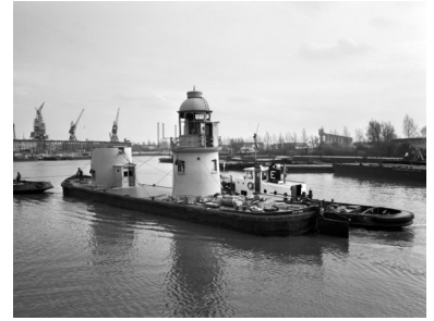
Op 9 maart 1977 werd het lage licht op een dekschuit naar Rotterdam gevaren.

Een groot deel van het exterieur is nog authentiek. Zelfs het tochtportaalje voor de ingang en de toegangsdeur zijn nog origineel. Het lichthuis heeft nog de originele raamconstructie van 1912. Eenmaal in Rotterdam zijn er, in 1977, nieuwe ruiten in geplaatst. Het centrale grote raam heeft toen echter geen rode ruit gekregen, zoals dat historisch gezien was te prefereren.