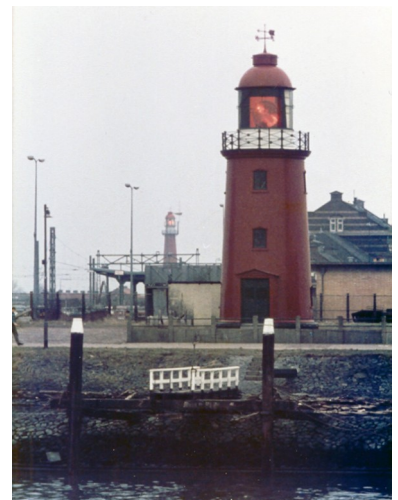
Het lage licht omstreeks 1965, met op de achtergrond het hoge licht.